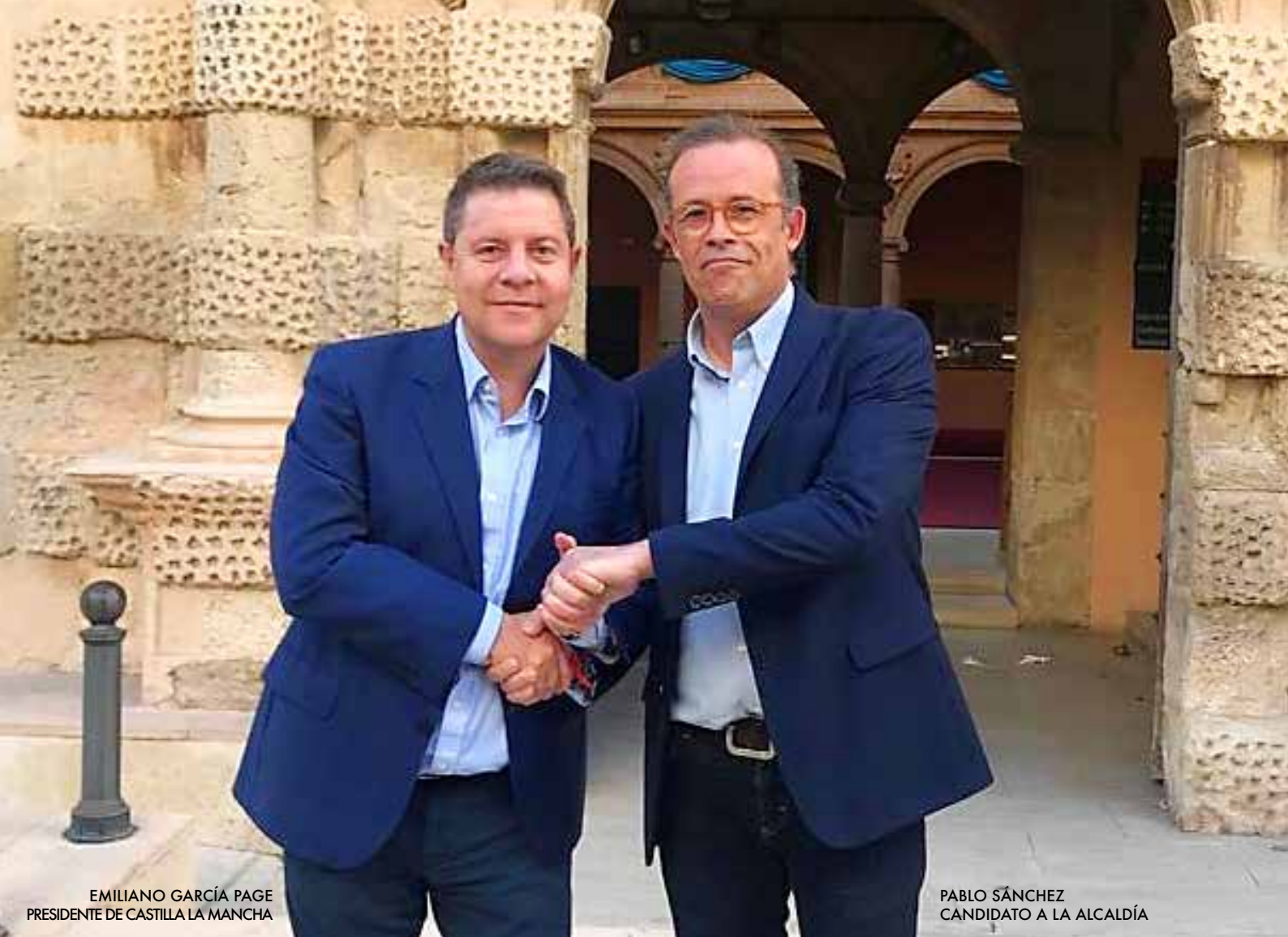
EMILIANO GARCÍA PAGE PRESIDENTE DE CASTILLA LA MANCHA